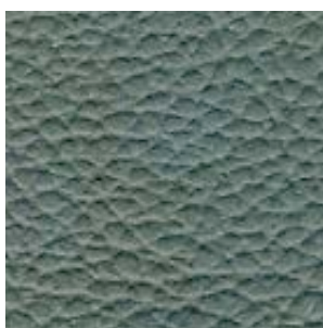
SAAB Dark Pewter