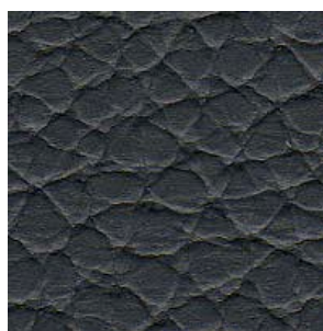
SAAB Grau/Grey/Slate Grey